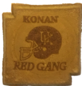
アメリカンフットボール部